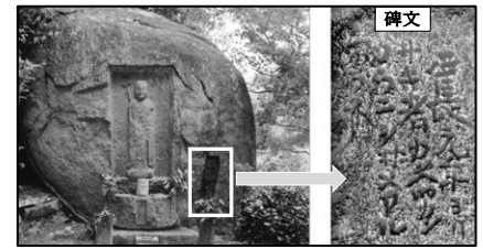
資料元：奈良市文化財課・教育委員会 ※問題作成のために、一部を加工しています。